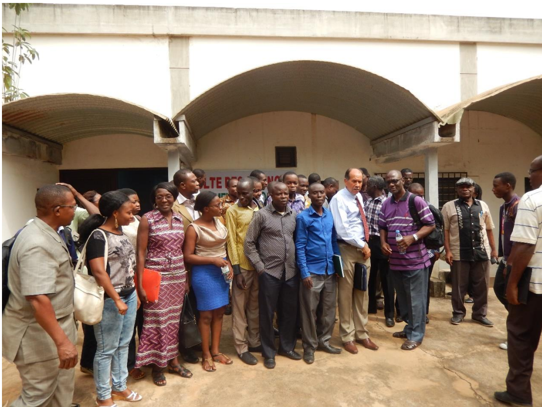
Photo 3. Vue des participants et des experts aux séminaires thématiques du CERSA