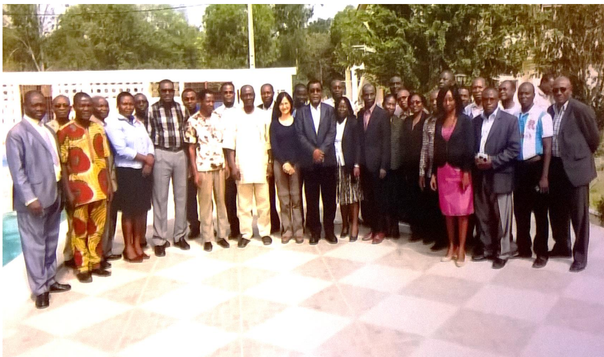
Photo 2. Vue des participants et des experts à l'atelier de Notsè sur l'assurance qualité des offres de formation du CERSA