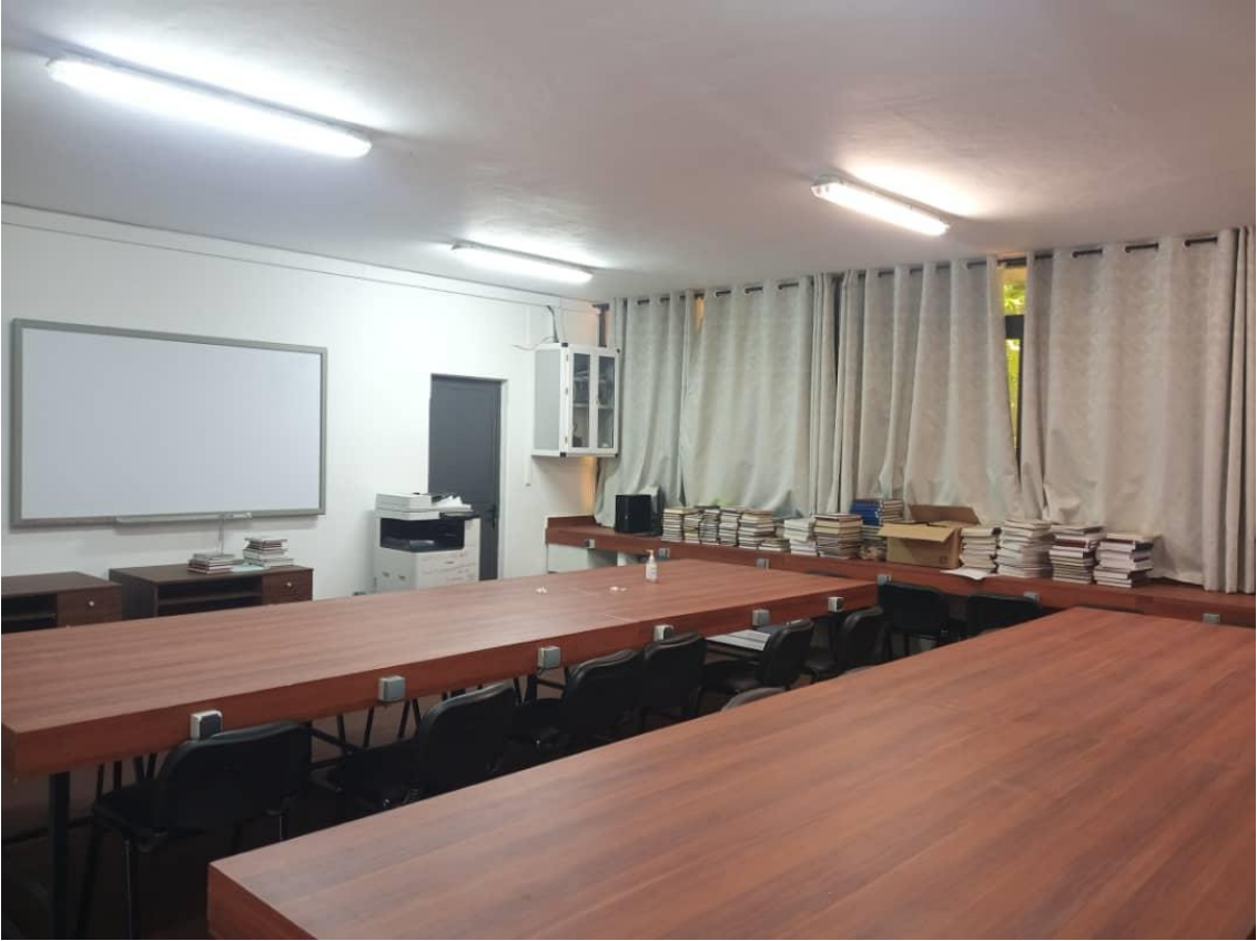
Salle de l'unité de support technique pour les étudiants et les enseignants