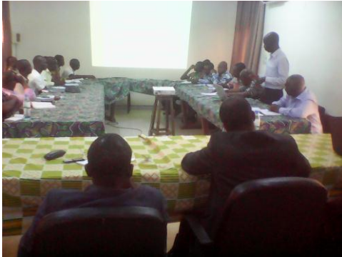
Vue de l'assistance lors de la présentation du Prof. Tona

La séance a été ponctuée de questions-réponses sur différents aspects de la filière aviaire tels que : est-il bon de consommer beaucoup de viande et d'œufs ? La formation offerte par le CERSA se limite-t-elle à l'élevage du poulet uniquement ? Quel est le processus de soumission de dossiers de recherche à financer ?